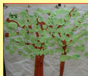
ひよこ保育園児の絵