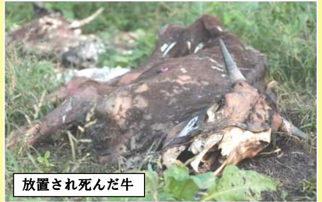
放置され死んだ牛