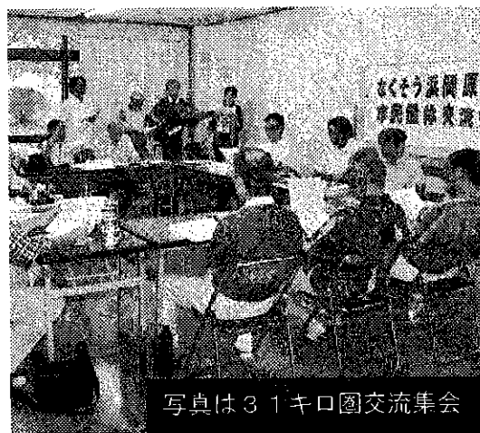
写真は31キロ圏交流集会