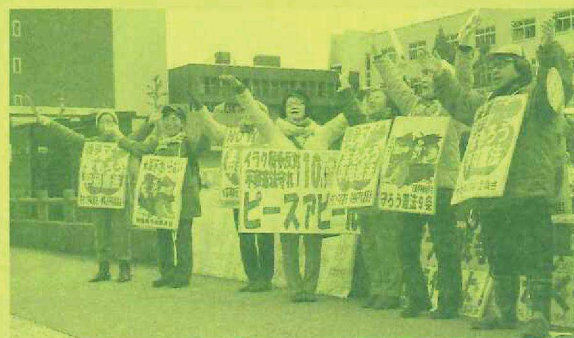
青森で毎月2回、街角ピースアピール

「アジアの平和への新たな ビジョン—いまこそ、非核 平和のイニシアティブを—」 をテーマに徹底討論!