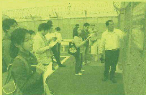
青年が岩国基地をフィールドワーク