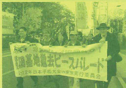
デコレーションを持ち寄って元気に