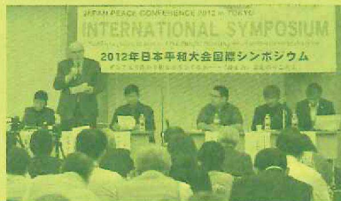
国際シンポはいつも白熱

ASEAN政府代表やアジアの市民運動代表も参加。軍事同盟ではなく、憲法9条の平和外交でこそアジアの平和を実現できることを明らかに