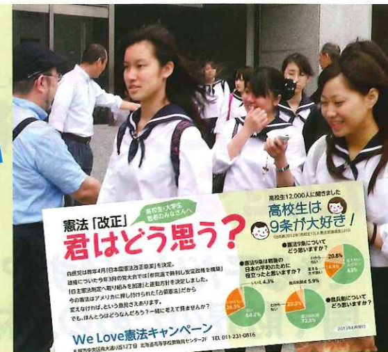
北海道では高校生に「憲法リーフ」を手渡しました。

「私は憲法〇〇条が好きです」と一人ひとりのメッセージが全国の教職員から寄せられました。