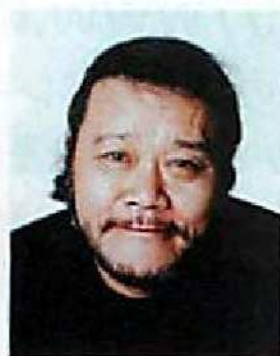
俳優 西田 敏行さん

今、民主主義の快走が憲法を守る。人権をさしかざす。自衛の名の下の攻撃を拒絶する。平和のために結集する市民たちに乾杯!