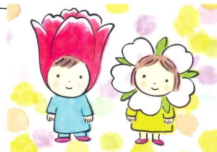
イラスト 大月書店絵本 「あなたこそたからもの」より

「核戦争から子どもの命を守ろう」と始まった母親大会は、子育て、教育、暮らし、防災、平和など、その時々願いを持ち寄って話し合い、学びあい、今年で62年の歴史を積み重ねてきました。一人で悩まず、みんなで支え合い、知恵を出し合い、手をつなぎましょう。男性も大歓迎！ みなさんお誘い合わせてお越しください。