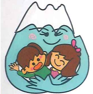
イラスト：鈴木直子