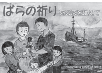
ばらの祈り 死の扉を越えて

大学も含めた教育の無償化は世界の常識。経費削減を優先し、市場原理で格差をつけようとする