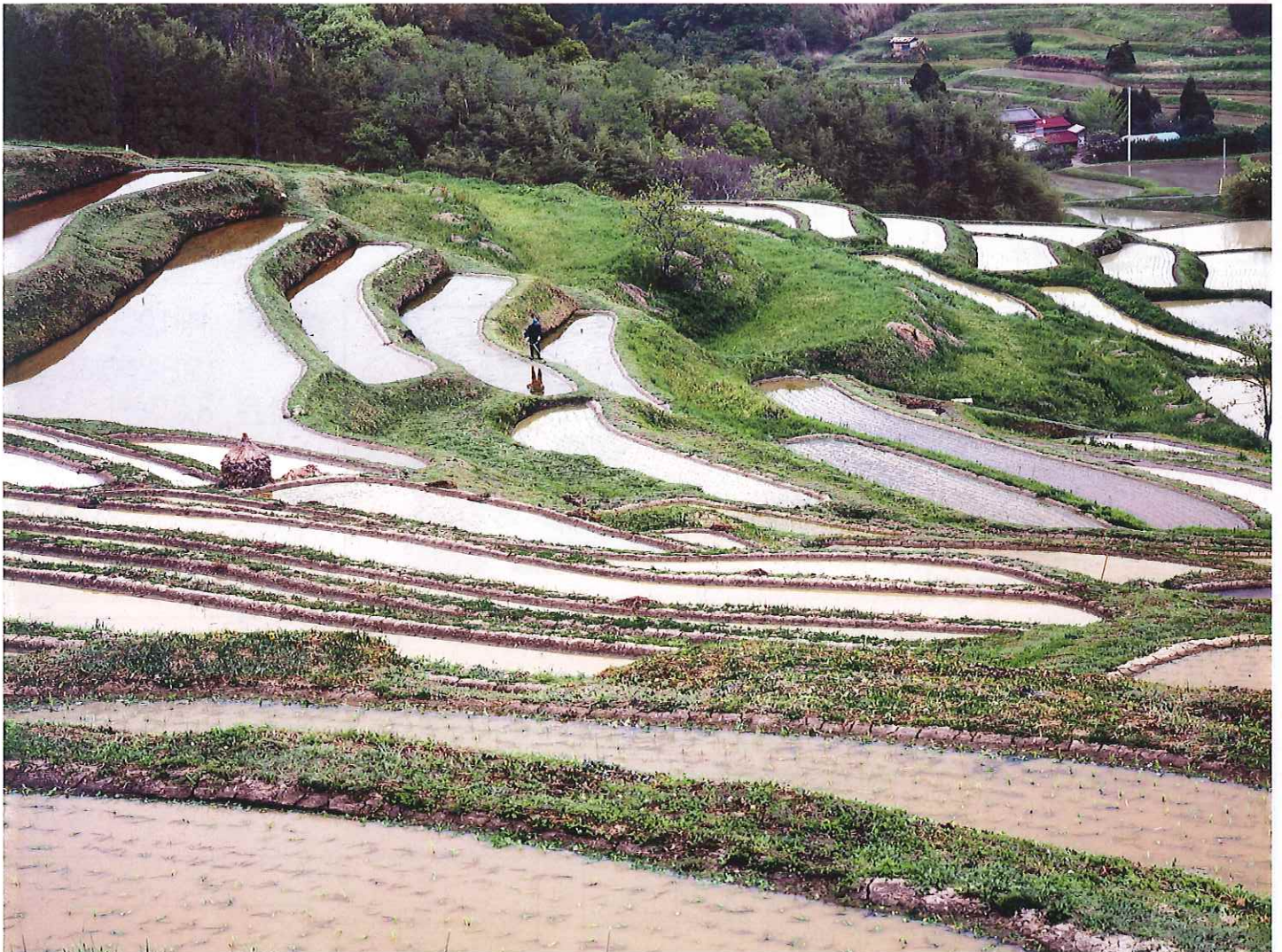
(千葉県鴨川市 大山千枚田『草刈』 岡野京)

2019年8月10日(土)～12日(祝) 船橋グランドホテル・船橋市勤労市民センター他