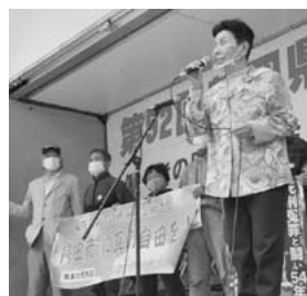
5月1日(土)第92回静岡中央メーデーが静岡市の青葉公園で開かれました。

子どもたちの生活に根差し、子どもの思いから出た教育こそ、子ども自身がつながるのではないのでしょうか。