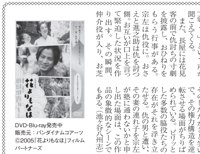
DVD・Blu-ray発売中 販売元：バンダイナムコエンターテインメント ©2005「花よりもなほ」フィルムパートナーズ

この作品には、強いものの傲慢と暴力に対して、弱いものたちがそのしたたかさや笑い、その権力構造を逆転させる場面がさりばめられて、ピリッとした多数の脇役たちの存在がそれを浮き立たせる。仇の男と遭い、その妻の連れ子宗左が塾に通わないかと申し出た場面は、この作品の象徴的なシーンでもある。(池ヶ谷八州志)